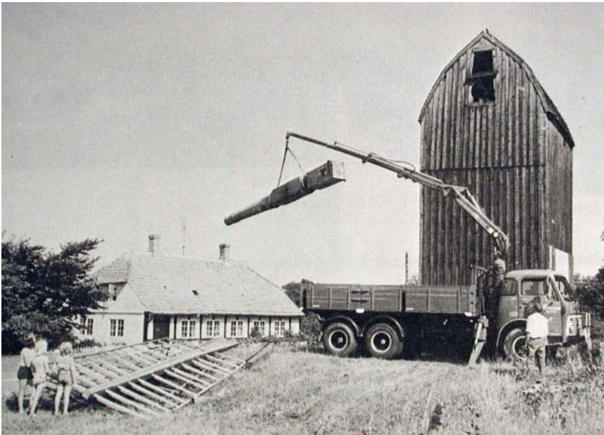
Ny ås , aksel, indlægges 1973.

Byforeningen Svaneke's Venner overtog møllen, og har siden passet vel på den. 1983 blev bræddebeklædningen udskiftet. Møllen er blevet overfladebehandlet og vingerne opkilet i 1987.