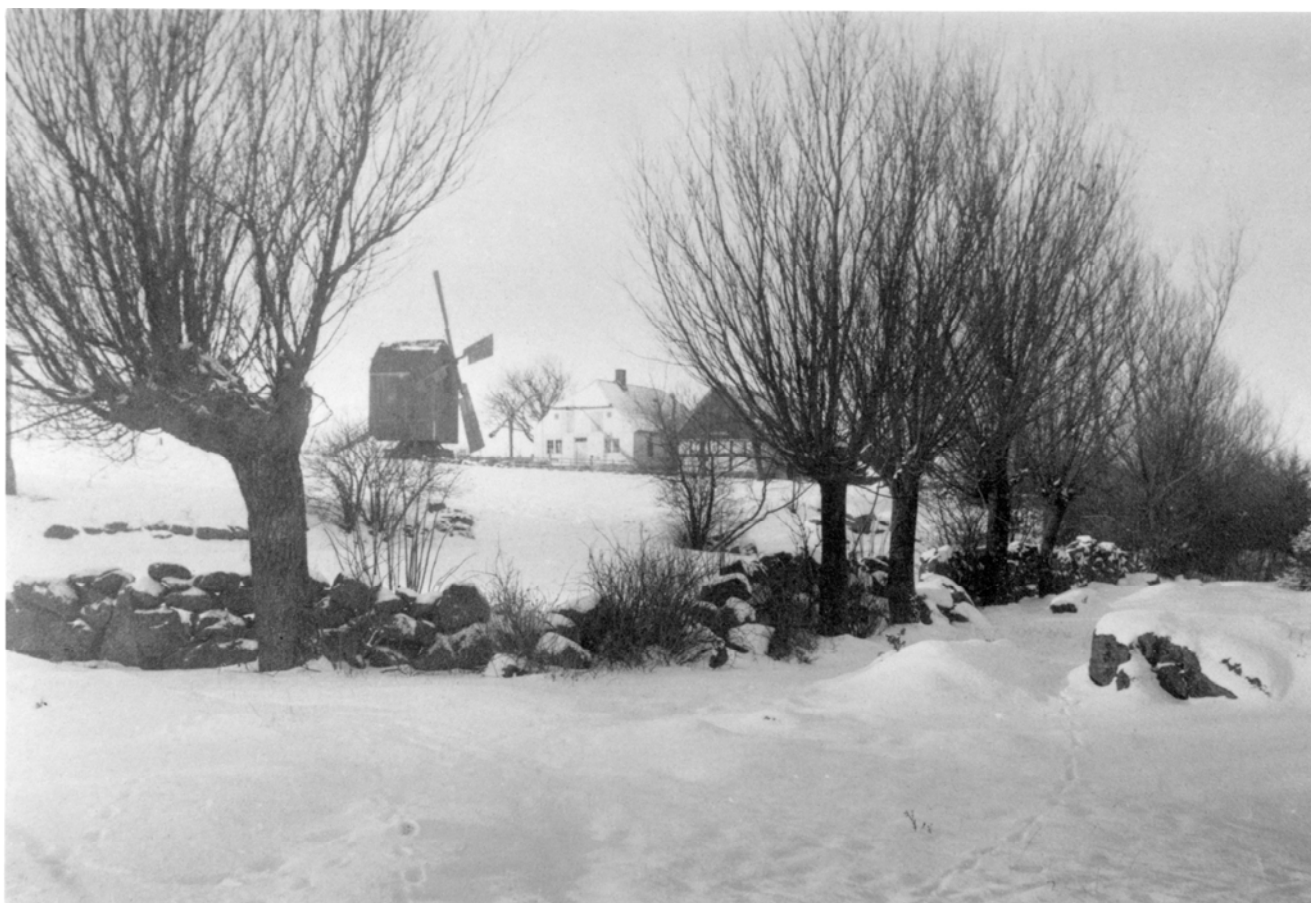
Svaneke Stubmølle og det nye møllehus.