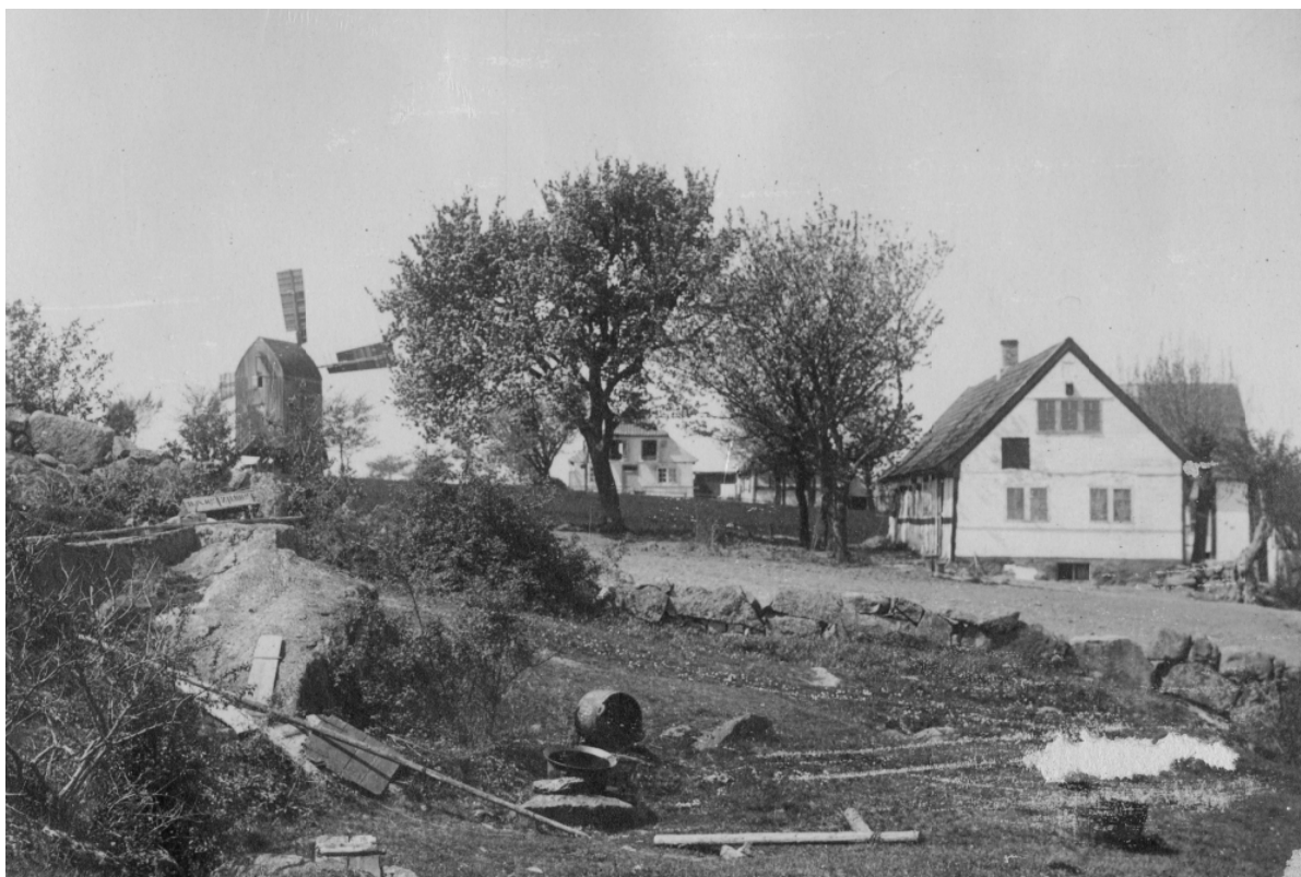
Yderst til venstre ses "Mølleedal" Møllebakken 8, som var det gamle møllerhus til Svaneke Stubmølle